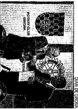
DAIÀ DE GIRONA

El Rotary vol col·locar un monument i convocar uns premis